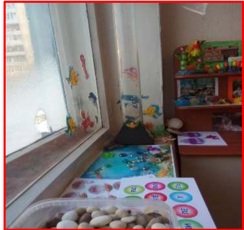
Дидактическое панно « Подводный мир »