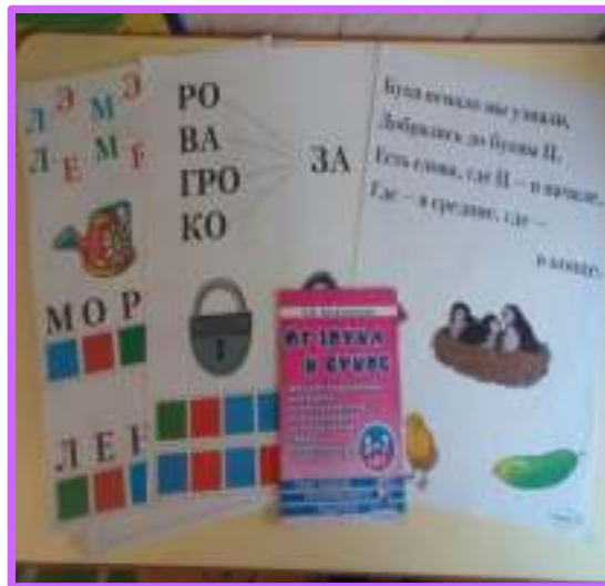
«От звука к букве»