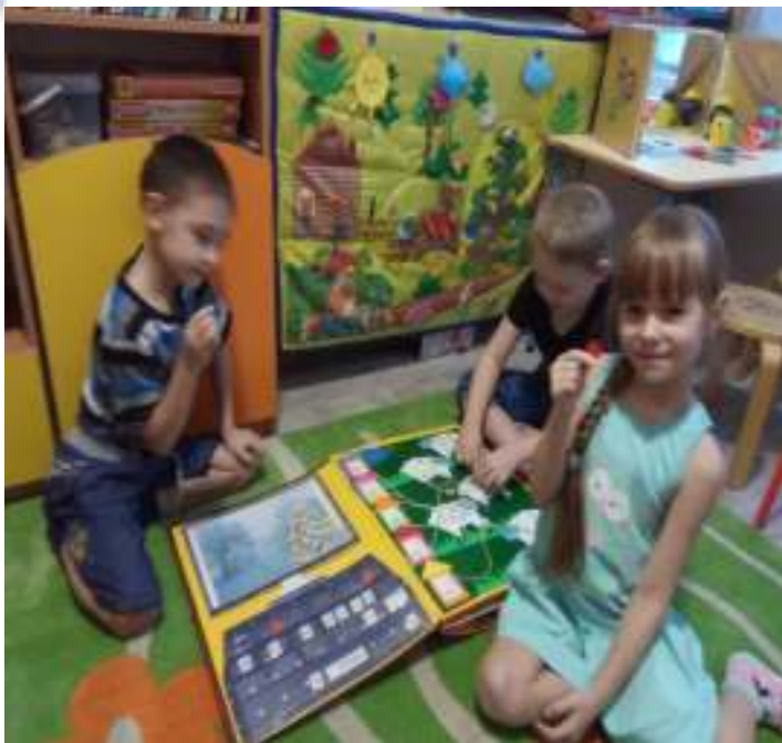
Любимая страничка лэпбука «Умный компьютер»