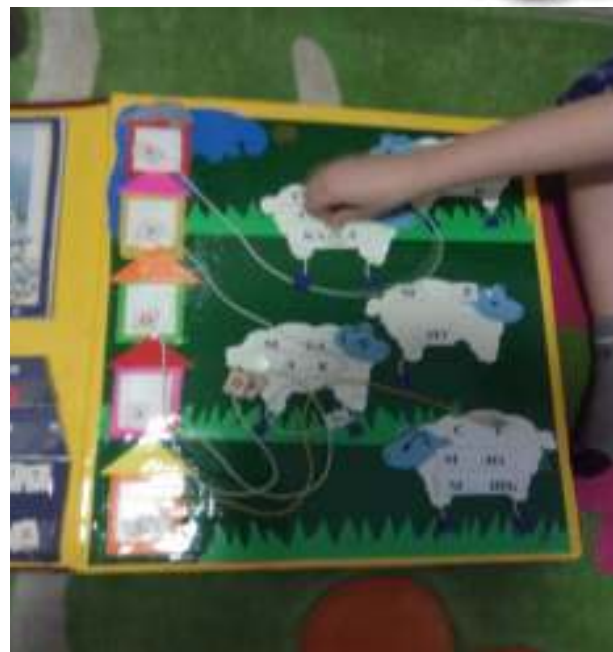
А с помощницей овечкой поиграем мы в словечки